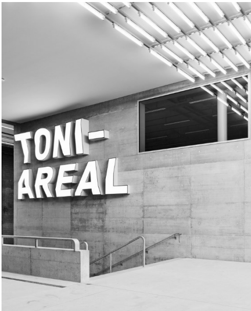
Bildungsanlage: Toni-Areal, Zürich Ausstattung IT